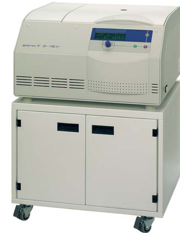
No. 17918 (3-18K) Fahrbarer Untertisch mit 2 Türen und feststellbaren Rollen. (B x H x T, 690 x 497 x 635 mm) Table with 2 doors and lockable castors. (W x H x D, 690 x 497 x 635 mm) No. 17919 (3-18) (B x H x T, 571 x 515 x 635 mm) (W x H x D, 571 x 515 x 635 mm)